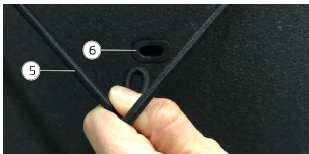
Abb. 4 / fig. 4

Align the child cover optimally by tensioning or releasing the elastic cords