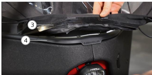
Abb. 2 / fig. 2