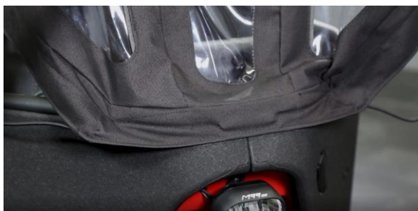
Abb. 3 / fig. 3