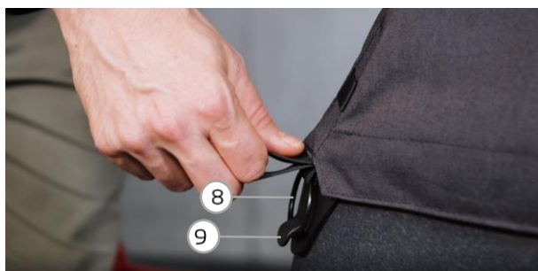
Abb. 6 / fig. 6