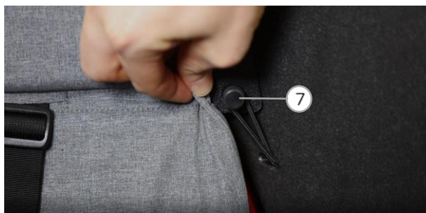
Abb. 5 / fig. 5